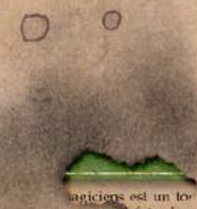
magiciens est un tor

En général, les mages-voleurs préfèrent les magies qui ne sont pas immédiatement visibles afin que leurs victimes ne puissent pas les identifier comme des magiciens. Ils suivent souvent les techniques de combat de l'École de Ramius pour ses tactiques moins voyantes. Plutôt que de lancer des sorts d'attaque, les hors-la-loi rusés préfèrent faire appel à une magie de reconnaissance, de défense et d'évasion.